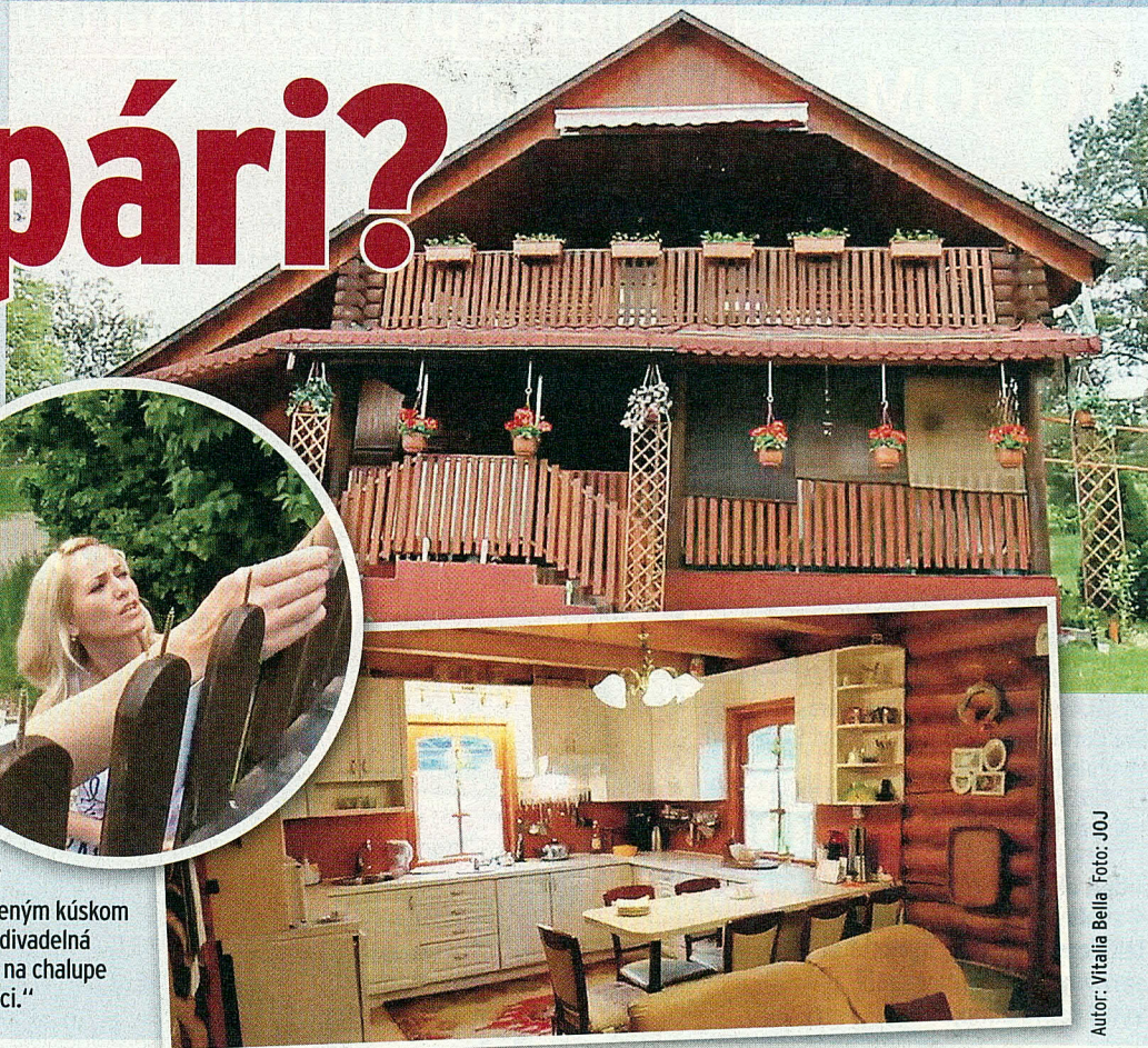
Autor: Vítalia Bella Foto: JOJ