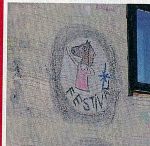
Monika ukazuje, že u nich je povolené kresliť aj po fasáde domu.