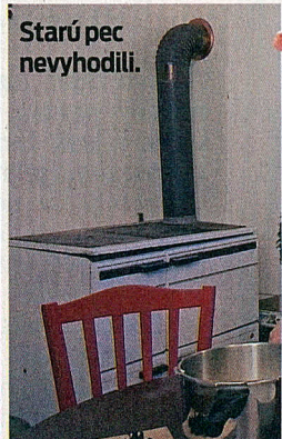
Starú pec nevyhodili.