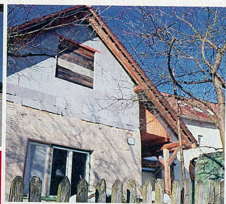
S prerábaním ani zďaleka nekončia.