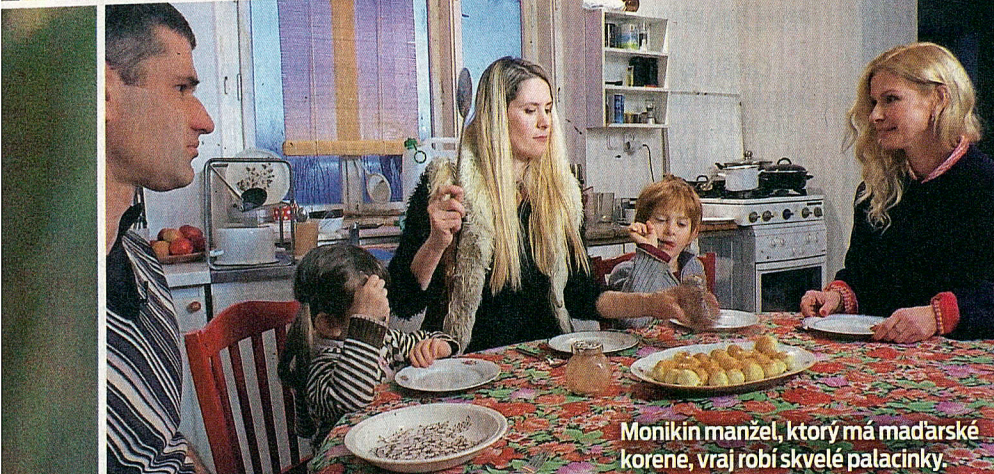
Monikin manžel, ktorý má maďarské korene, vraj robí skvelé palacinky.