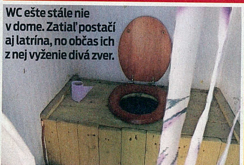
WC ešte stále nie v dome. Zatiaľ postačí aj latrína, no občas ich z nej vyženie divá zver.