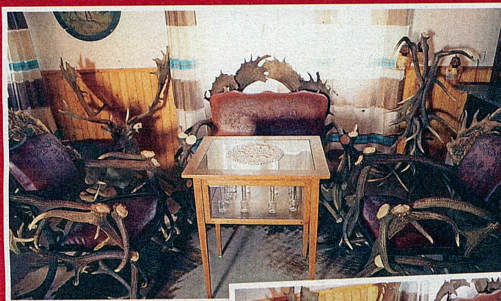
„Každá trofej má príbeh. Nepatrí to do domovov, ale na takéto miesto. Pre mňa je to chrám.“