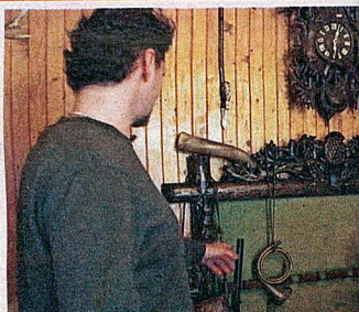
Predchodca mobilov lesnica kedysi slúžila na dorozumovanie.