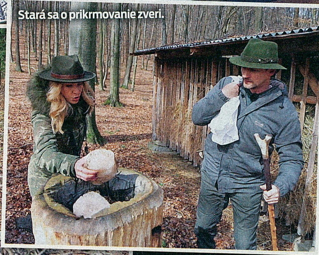
Stará sa o prikrmovanie zveri.