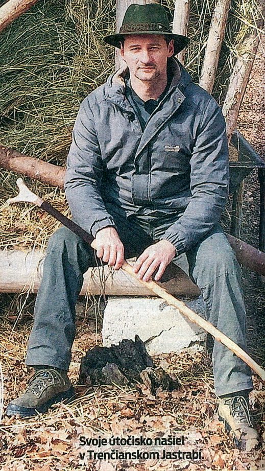
Svoje útočisko našiel v Trenčianskom Jastrabí.